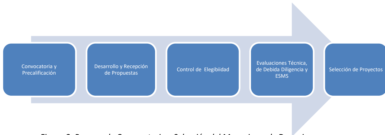
Figura 2. Proceso de Convocatoria y Selección del Mecanismo de Donaciones

Este proceso se desarrolla en cinco fases consecutivas, desde la convocatoria hasta la selección final de los proyectos, tal como se muestra en la Figura 2.